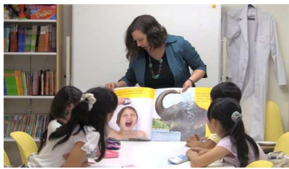
キッズ英語クラスの実力養成授業

東京やさいたま市では小学1年から英語教育を始めていることや、英語教室が都市部に集中していることも、今回の学力テストの英語の成績の結果に現れています。姉妹校の武蔵野エムズ・アカデミーでは小学5年生が今回の英検で2級に合格しています。